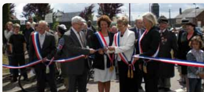
Inauguration des expositions de Quevreville-la-Poterie

À l'occasion de la commémoration du 70 e anniversaire de l'Appel du Général-de-Gaulle, Catherine Morin-Desailly s'est rendue le samedi 19 juin à Quevreville-la-Poterie. La commune organisait en effet un week-end exceptionnel où se mêlaient cérémonies, expositions et reconstitutions en l'honneur de cette journée anniversaire.