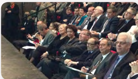
Au Havre, à l'assemblée générale de l'association départementale des maires de Seine-Maritime, l'occasion de sensibiliser le Préfet et le Recteur aux difficultés des collectivités territoriales.