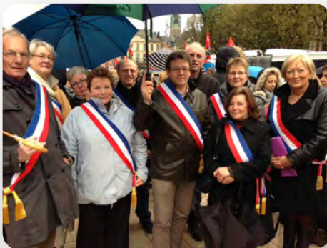
À Rouen, le 14 novembre pour manifester contre les conditions de la mise en place de la réforme des rythmes scolaires avec des élus de Seine-Maritime.