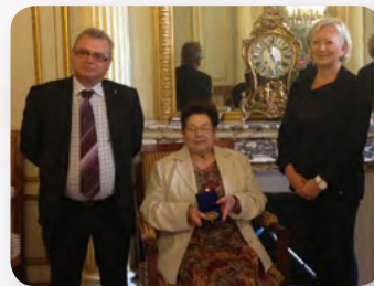
Simonne Monnier entourée de Dominique Beigle - maire et Catherine Morin-Desailly

En 3 décennies d'élue, elle a monté les isolements pour : 7 législatives, 6 européennes, 5 présidentielles, régionales, cantonales et municipales, 3 sénatoriales et 2 référendums.