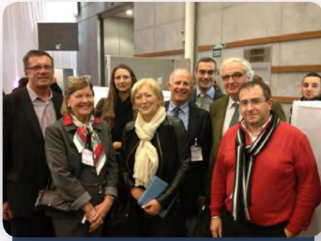
Le 20 novembre avec les élus seinomains lors du 96 e congrès des maires et des présidents de communautés de France, à Paris.